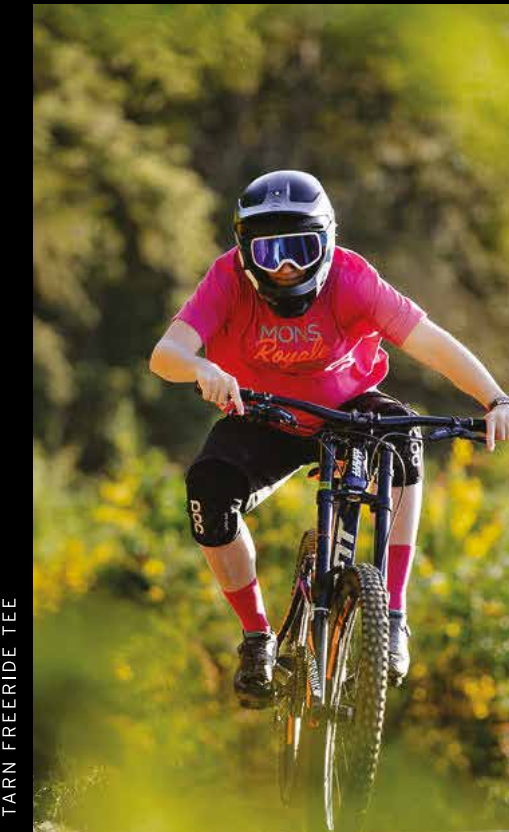
TARN FREERIDE TEE