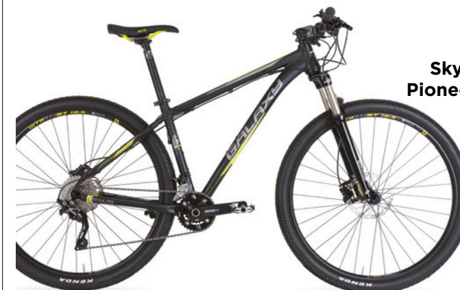
Skylab 7.0 29" Pioneer 7.0 27,5" 19 990 Kč