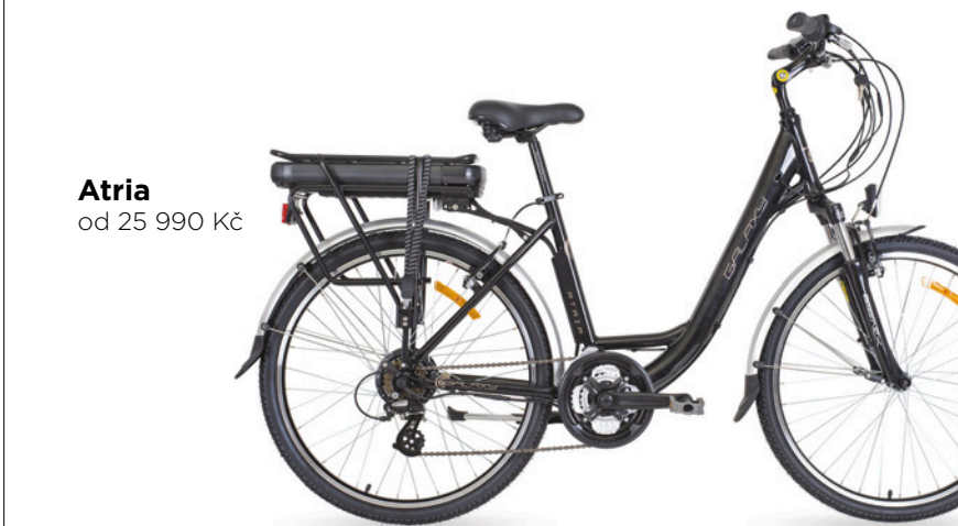
Atria od 25 990 Kč