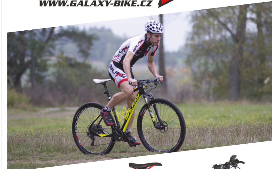
Skylab 9.0 29" Pioneer 9.0 27,5" 24 990 Kč

Překvapilo mne, jak jednoduché otázky Selle San Marco vedly k výběru ideálního sedla. Jistě, je možné, že se člověk nechá ovlivnit, že kotouč plný informací zafunguje jako placebo, ale to snad v začátku. Ono když pak na každém sedle strávíte měsíc, rozdíly snadno vyplavou na povrch.